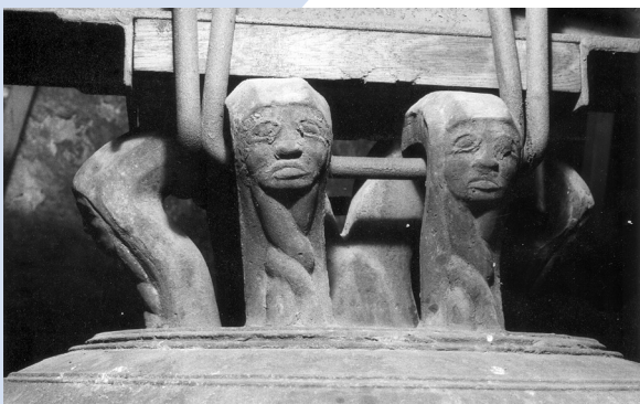
Gütersloh 1484

II. Glockenpflege: Aufgaben und Chancen, dargestellt an ausgewählten Praxisbeispielen.