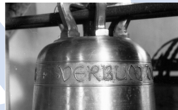
Dortmund-Wellinghofen 2006

15.30-16.30 Uhr Besichtigung des Geläuts mit vorheriger Einführung: Glocken von 1639 und 1646: Restaurierung und Reparatur von Glocken und Glockenstühlen, Umgang mit historischen Glocken, klangliche Vorführung